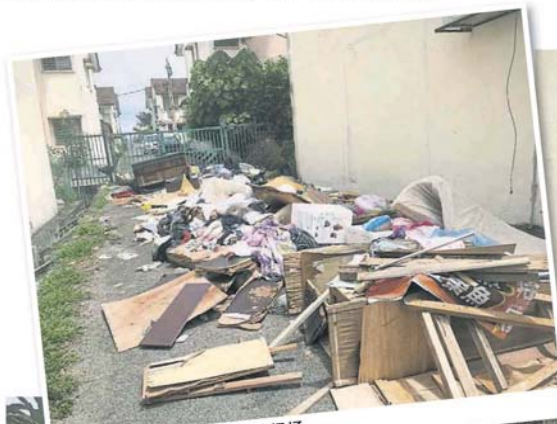
■其中一条小巷, 沦为非法垃圾场。