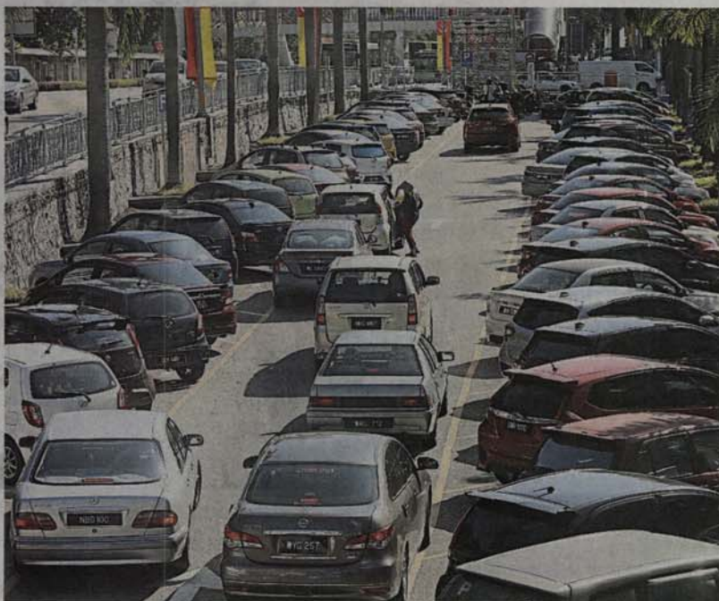
■八打灵再也新镇大部分停车位一大早即爆满，民众往往难寻停车位，因此拉吉夫建议限时收费。(档案照)

(八打灵再也19日訊) 行动党武吉加星州议员拉吉夫于去年12月杪，征询八打灵再也新镇民众提出当地限时泊车的意见与看法，许多民众赞同八打灵再也52/2路限时泊车，以舒缓难寻停车位的问题，因此拉吉夫将综合市民的看法，提呈该路限时泊车2小时建议书给八打灵再也市政厅。