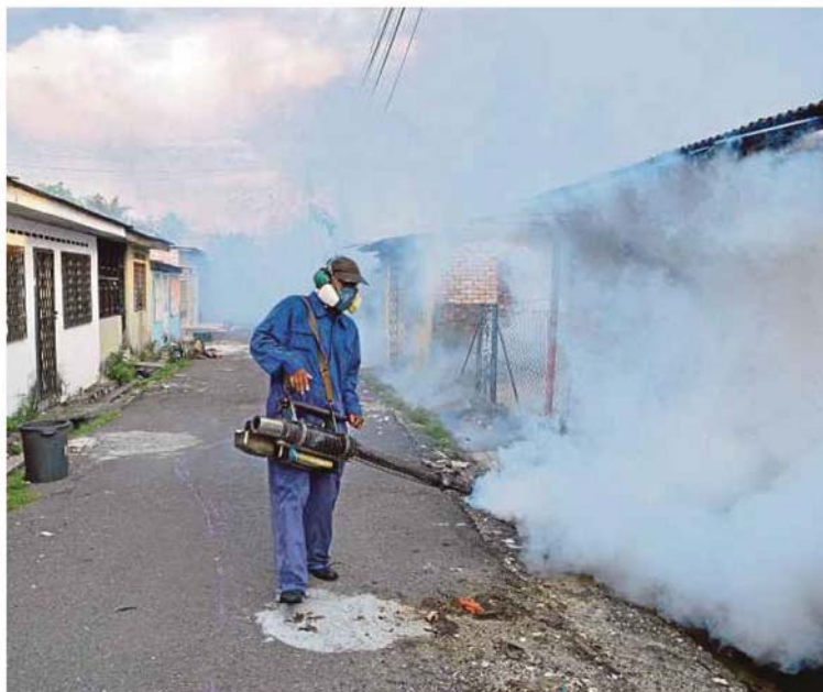
A Klang Municipal Council employee conducting fogging at a housing area in Taman Tengku Bendahara Azman, Port Klang. Local communities must play a part in the fight against dengue.

"This must be the agenda of local councils, non-governmental