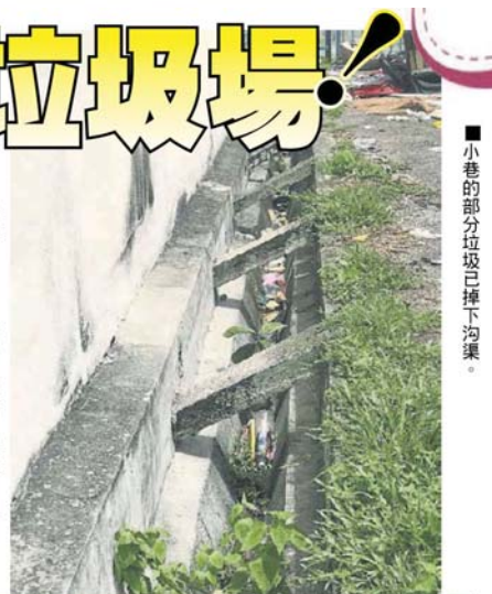
■小巷的部分垃圾已掉下沟渠。