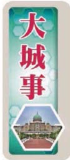
■皇冠城第8区 多条后巷都有 非法垃圾堆。

Provided for client's internal research purposes only. May not be further copied, distributed, sold or published in any form without the prior consent of the copyright owner.