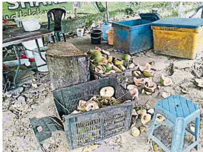
售賣椰子的小販在營業後留下不少椰殼，影響環境衛生。

(士拉央市議會) 條例第3節和1974年道路、水溝和建築法令的第46 (1) a項條文對所有涉及的攤位進行充公。