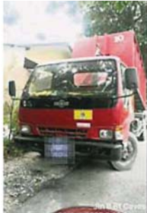
在掌握到该名车主的住所后，市议会随即上门，开出罚单对付车主。

Provided for client's internal research purposes only. May not be further copied, distributed, sold or published in any form without the prior consent of the copyright owner.