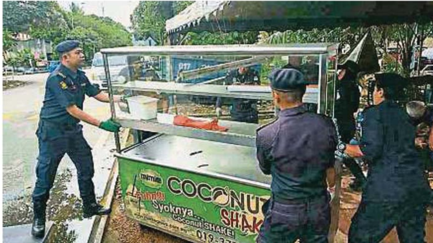
執法人員在取締行動中充公了無執照小販的攤子。

(士拉央19日訊) 士拉央市議會日前展開了兩項取締行動，掃蕩了不少非法攤子，以取締無牌小販。