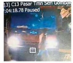
士拉央市议会透过闭路电视，掌握该名非法丢垃圾人士的资料，并再做一步的对付行动。