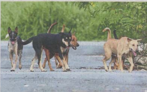
A pack of stray dogs roaming in an alley off Jalan Jambu Bol 2 in Taman Gembira, Klang.