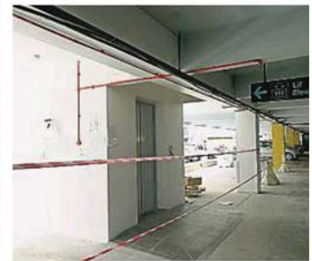
八打灵再也新都A广场多层停车场安装电梯的工程原定2019年完工，惟因出现技术问题而延期竣工。