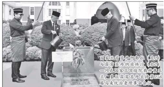
国家元首苏丹阿都拉 (左2) 与霹雳苏丹纳兹林沙 (右2) 一同在国家王宫庭院栽种黄玉兰，象征霹雳苏丹主持第256届马来统治者理事会会议。

吉兰丹代表是丹州王储东姑莫哈末法依兹殿下，彭亨代表是彭州王储东姑哈沙纳殿下。檳城、马六甲、沙巴及砂拉越州元首也出席这项会议。