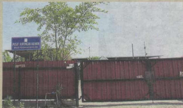
MPK's temporary dog shelter in Bandar Sultan Suleiman in Port Klang.

For details, call 03-3375 5555 ext 7310.