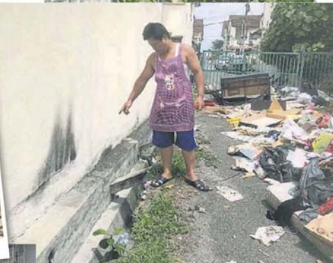
■阿凯指小孩到小巷玩火, 把墙壁也被熏黑。