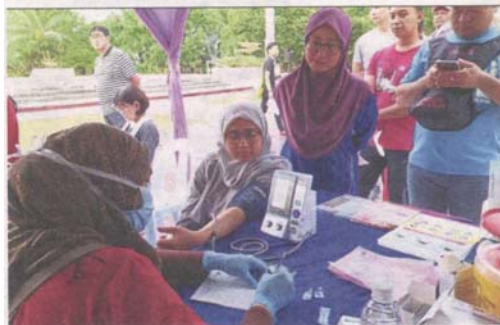
Visitors receiving free basic health screening from Sri Kota Specialist Medical Centre at the Sihat Fest 2020 carnival.