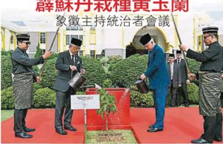
國家元首蘇丹阿都拉（左二）陪同主持會議的霹靂州蘇丹納茲林沙（右二）在國家皇宮花園共植黃玉蘭花樹。

（吉隆坡19日訊）霹靂州蘇丹納茲林沙殿下今日在國家皇宮庭院栽種黃玉蘭，象徵主持第256屆馬來統治者理事會會議。