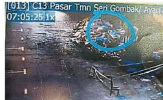
斯里鹅唛花园丢垃圾热点区周边所安装的闭路电视，记录下该名车主在该处非法丢垃圾。