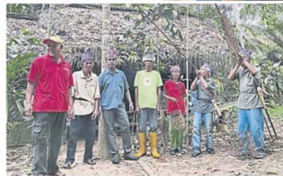
逾 2000 名原住民, 仰赖瓜拉冷岳北部森林保留地提供生计。

根据 2014 年雪州公共听证会法规和 1985 年国家森林 (领养) 法令, 若民众反对先报撤除森林保留地, 政府须召开听证会。