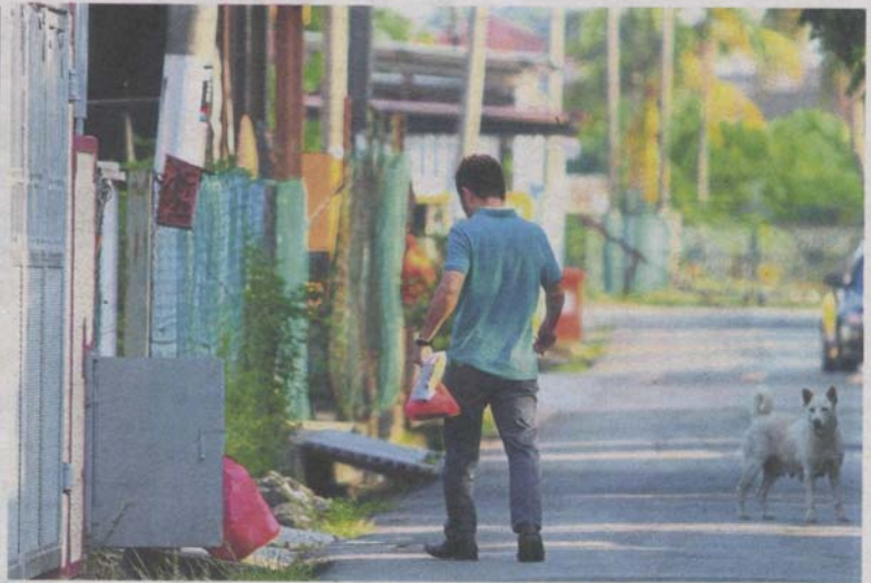
A stray dog at Lorong Kopi in Pandamaran, Port Klang. MPK receives an average of 1,300 public complaints annually about stray dogs being a nuisance.

Azmi added that while people were angry with the council for euthanising the dogs, the problem