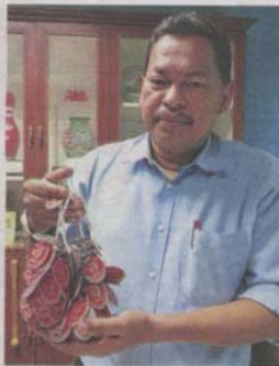
Azmi says dogs without tags are unlicensed and considered as strays.

StarMetro learned that some pet stores in Klang discard unsold dogs on the streets.